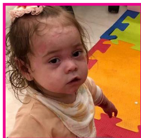
Epidermólise Bolhosa 39